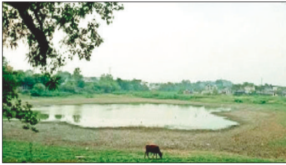
बाघ तालाब की दयनीय स्थिति।

सूत्रों की मानें तो शहर में कुछ ऐसे भी तालाब हैं, जिस पर अतिक्रमणकारी पहले अपना मकान तालाब के किनारे बना लेते हैं, जिसके बाद मौका पाकर धीरे धीरे अतिक्रमण के क्षेत्र को बढ़ाते हुए विक्रय भी कर रहे हैं। ऐसा नहीं